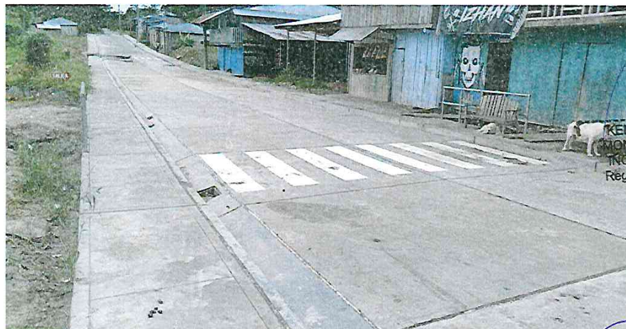
Señalización en losa de pavimento calle.30 agosto av. peruunidad

[Signature] KENYO ALBERTO MONTES CUELLAR INGENIERO CIVIL Reg. CIP N° 195722