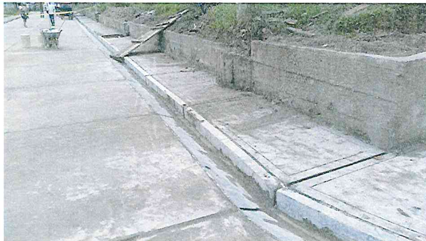
Muro de contención, vereda, sardinel, cuneta y losa de pavimento