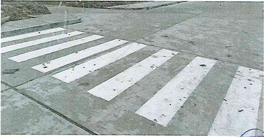
Muro de contención vereda, sardinel, cuneta y losa de pavimento.